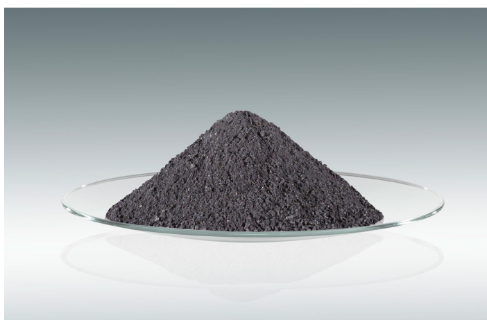
TANIOBIS 社が生産する高純度タンタル粉