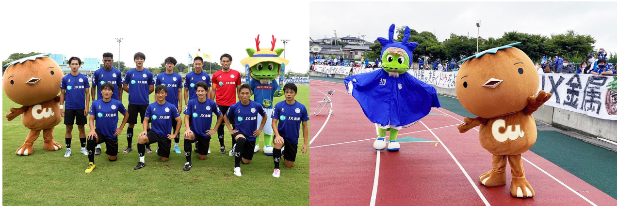
2022年8月28日 J エリートリーグ「J X金属サンクスマッチ」(日立市開催)