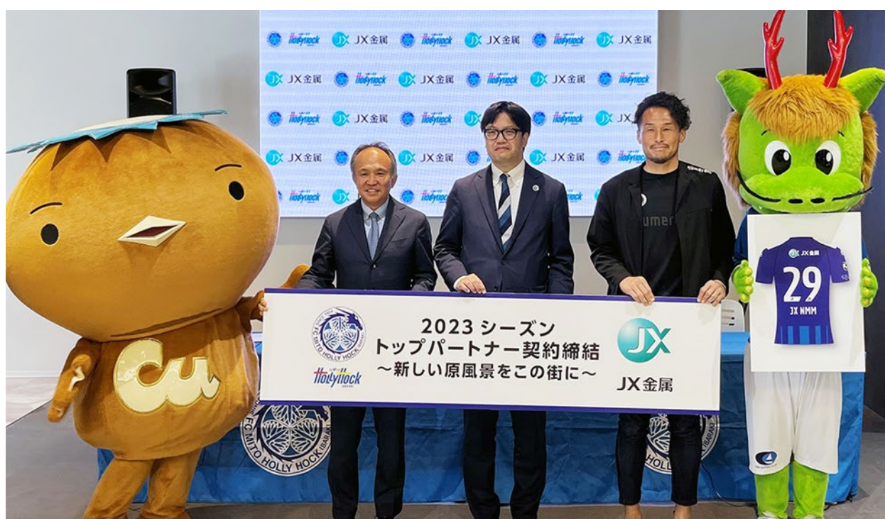
2023 シーズントップパートナー契約締結会見