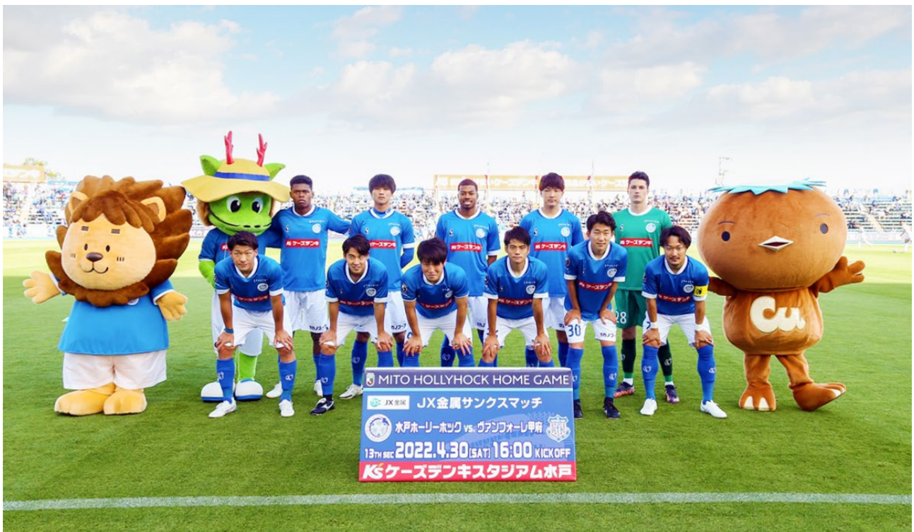
2022年4月30日「JX 金属サンクスマッチ」